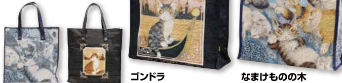
ゴンドラ なまけものの木

ゴブラン織で絵柄を再現することで、持ちやすく大人っぽい雰囲気になりました。 高さ・マチがあって沢山ものが入りそう!持ち手やフチ巻きは合皮です。